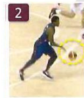
Dribble (ballon lâché) avant pose de l'appui n°2